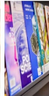
Journals and Newspapers