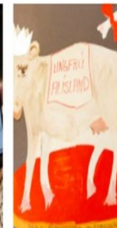
Women's History Archives