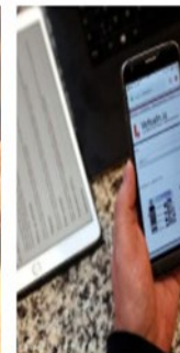
The Icelandic Web Archive