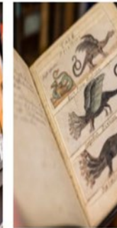
Manuscripts and Private Archives