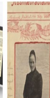
Highlight of the month